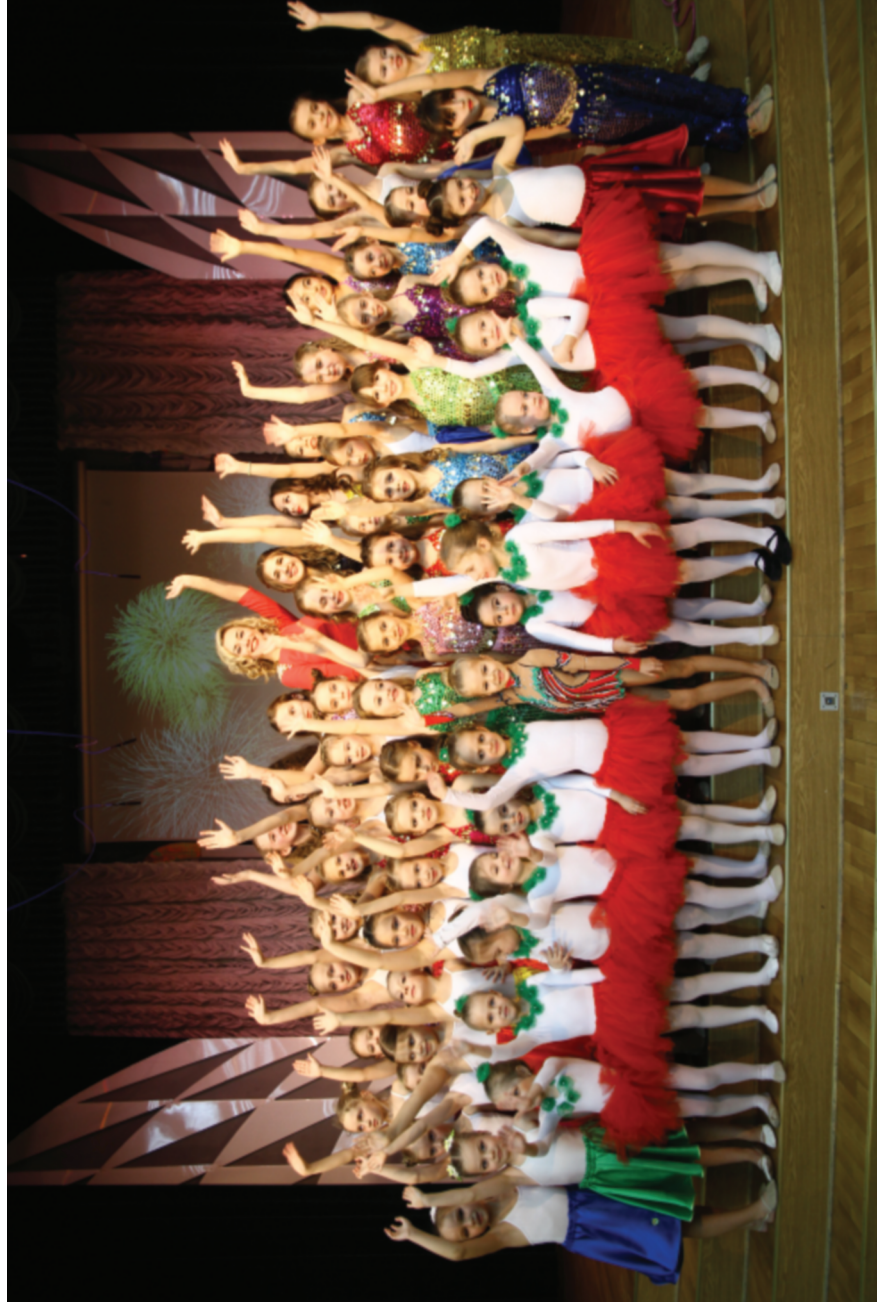
Объединение «Золотая ласточка» школы № 2006