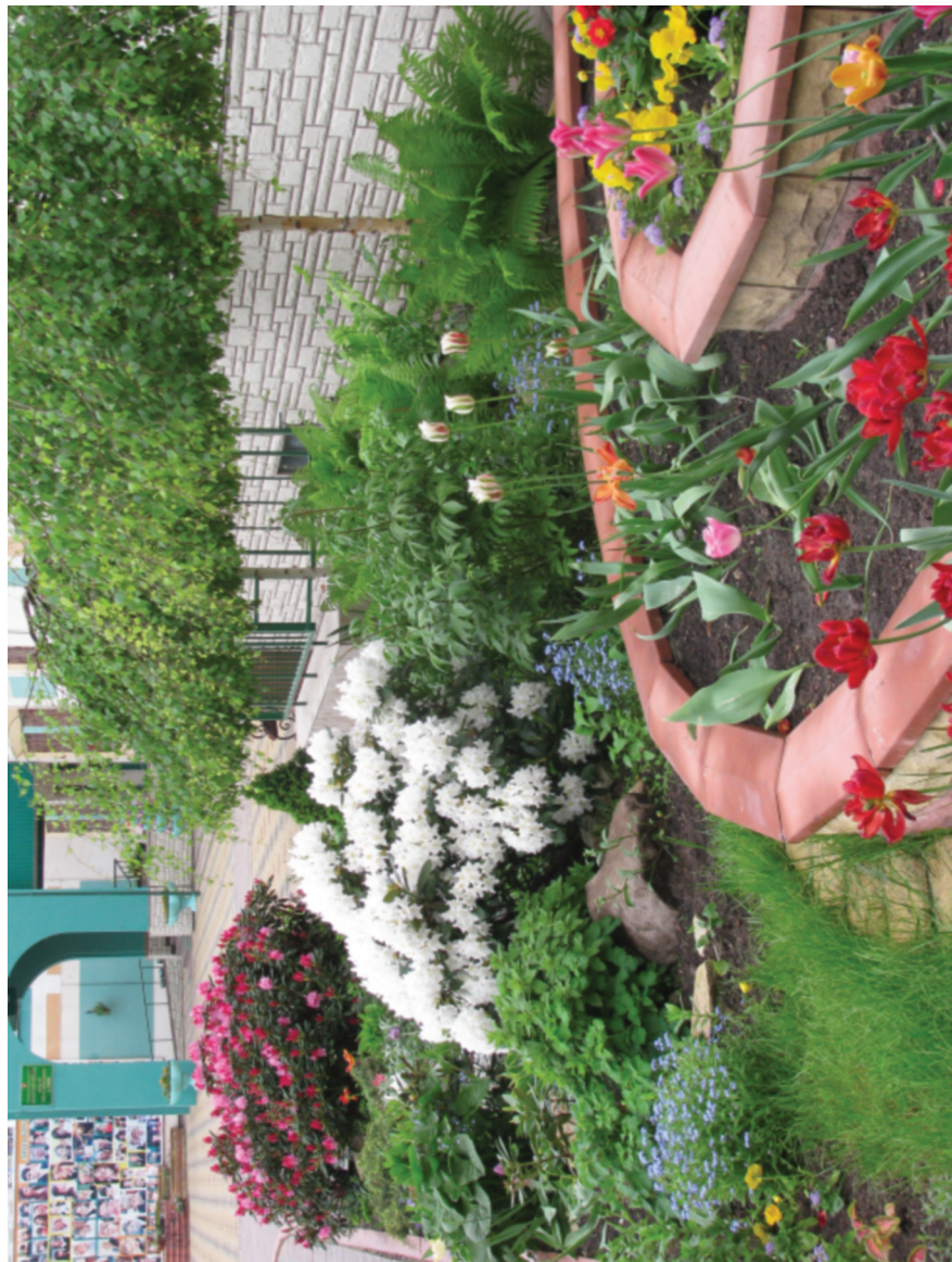
Клуб ландшафтного дизайна «Наш дом — наш двор» школы № 2006