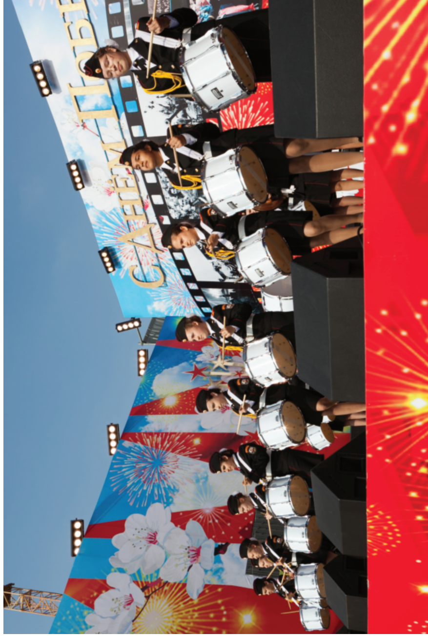
Ансамбль барабанщиков школы № 1770 на городских праздничных мероприятиях ко Дню Победы