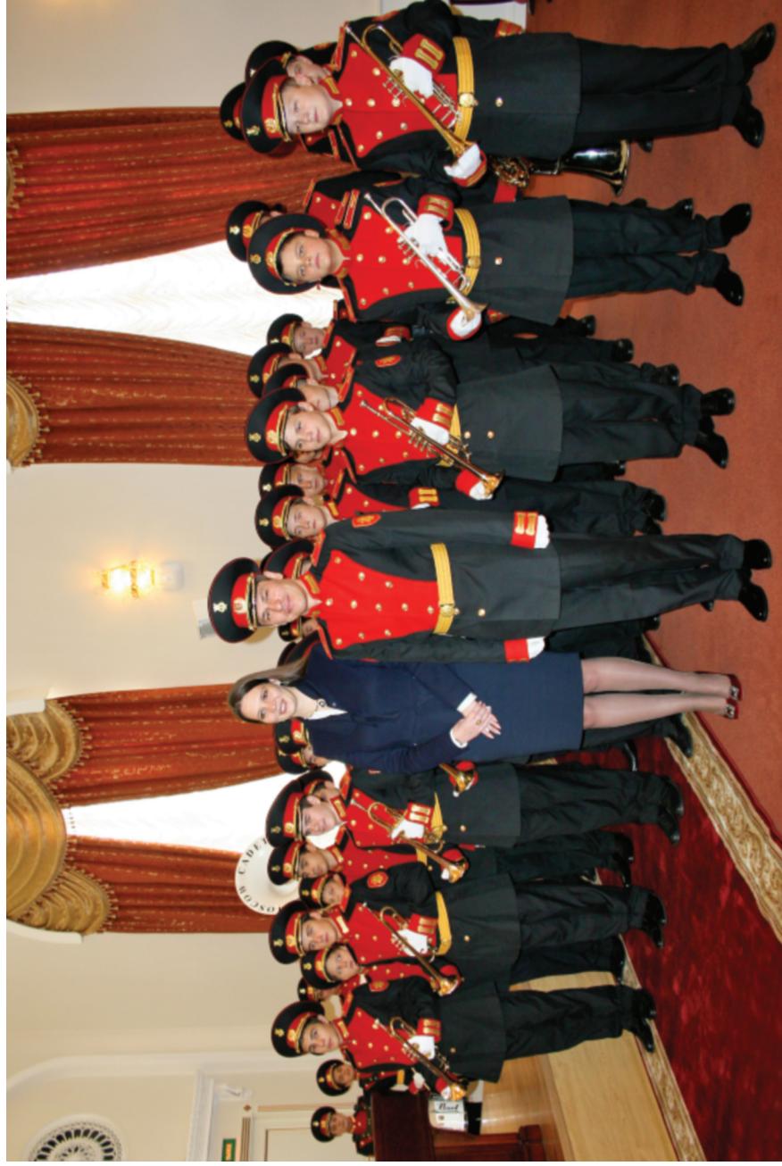
Концертный оркестр мальчиков школы № 1770 на торжественной церемонии награждения государственными наградами Российской Федерации работников образования и науки