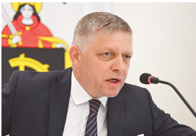
В словацком городе Гандлова совершено покушение на обвиняемого Западом в пророссийской позиции премьер-министра Словакии Роберта Фицо. Нападавшему 71 год.