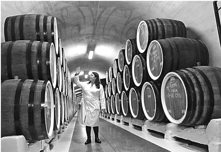
Массандровский подвал: глубина в начале — 5—6 метров, в конце — 53 метра. Сложное устройство позволяет выдерживать вино при температуре 14—15° С.

Винными турами в Крыму сегодня никого не удивишь, и турагентства соревнуются, пытаясь привнести в эту вечную тему свою изюминку или, как говорят виноделы, добавить оттенок вкуса. Скажем, в 3-дневном путешествии «Авторский винный тур» предлагают ужин с элементами эногастрономии. «Эно» — значит вино, «гастрономия» — приготовление еды. А все вместе — искусство подбирать и сочетать напитки к столу. Помимо общеизвестных истин — какое вино подходит к мясу или к рыбе — вас научат, как с помощью вина подчеркнуть вкус того или иного соуса, какое вино лучше до-