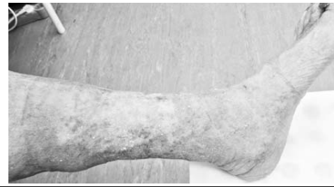
Нога пациента до и после терапии.

Каждый год наша клиника помогает более чем семи тысячам пациентов с различными флебологическими нарушениями. Ежегодно хирурги-флебологи проводят свыше трех тысяч операций различной степени сложности.