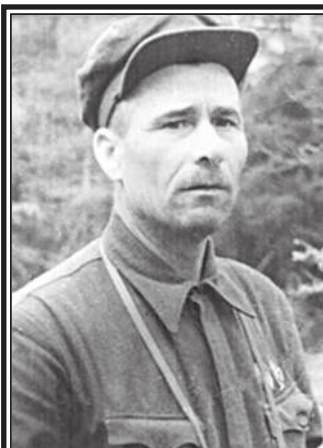
Минай Филиппович Шмырёв, участник партизанского движения в Витебской области, Герой Советского Союза.

Сегодня в номере «Советской России» читайте наше приложение к газете «ОТЕЧЕСТВЕННЫЕ ЗАПИСКИ»