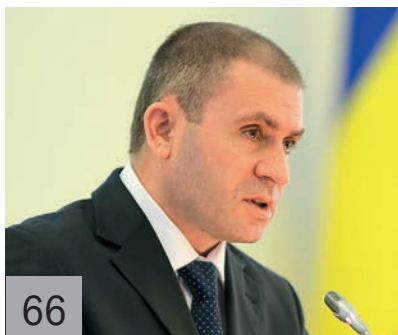
66 К. Н. РАЧАЛОВСКИЙ, министр сельского хозяйства и продовольствия Ростовской области