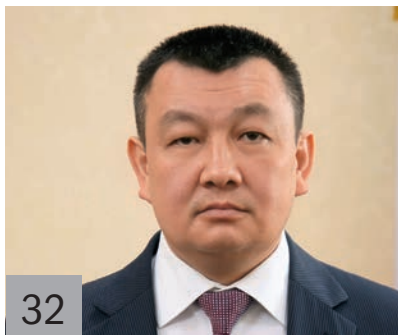
32 А. Г. СУМИН, министр труда, социального развития и занятости населения Республики Алтай