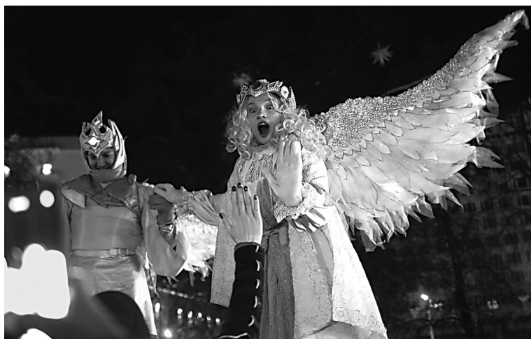
Равнодушными не остались даже ангелы.

Маршрут парада прошел по Большой Покровской улице, на которой сейчас установлена ярко иллюминированная конструкция, напоминающая ретро-трамвай. Именно она стала центром притяжения для любителей селфи. Кстати, если говорить не о буфаторском трамвае, а о настоящих электротранспортных средствах, изготовленных в стиле ретро, то на покупку одиннадцати таких вагонов правительство России выделило Нижегородской области 650 миллионов рублей. Все трамваи уже поступили в город, а большинство вышли на кольцевой маршрут. По словам губернатора области Глеба Никитина, ретро-трамваи «сочетают в себе исторический облик и последние технологические реше-