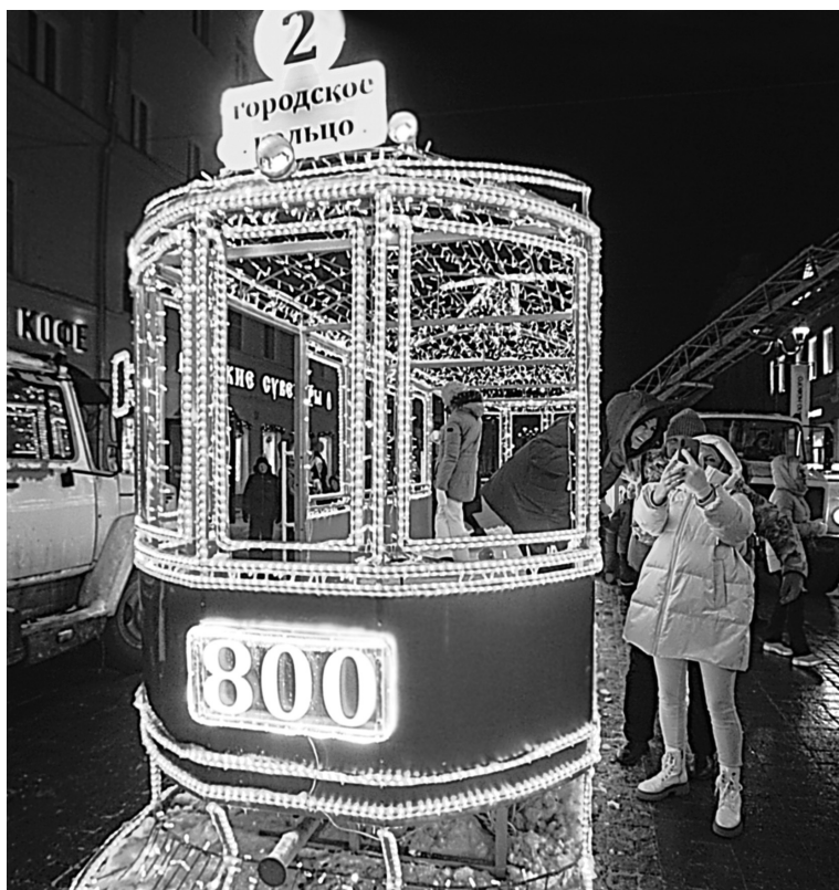
Ярко освещенный «ретро-трамвай» стал одним из самых привлекательных предметов праздничного убранства Большой Покровской.

ния». Вагон, стилизованный под старинный внешний вид, имеет анатомические деревянные сиденья, олдскульные плафоны освеще-