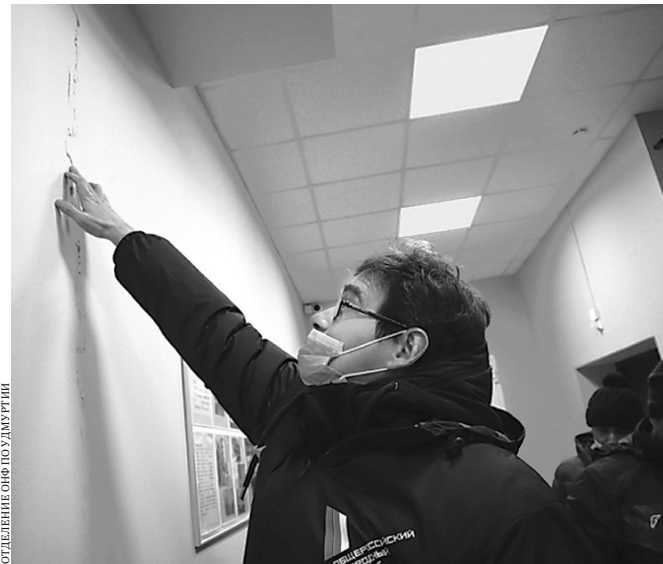
ОТДЕЛЕНИЕ ОНФ ПО УДМУРТИИ

Общественники направили обращение в прокуратуру и минстрой региона. Строи-