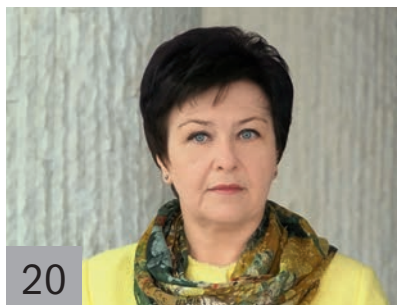
20 | Л. А. КАЛИНЧЕНКО , заместитель председателя Правительства Ставропольского края — министр финансов