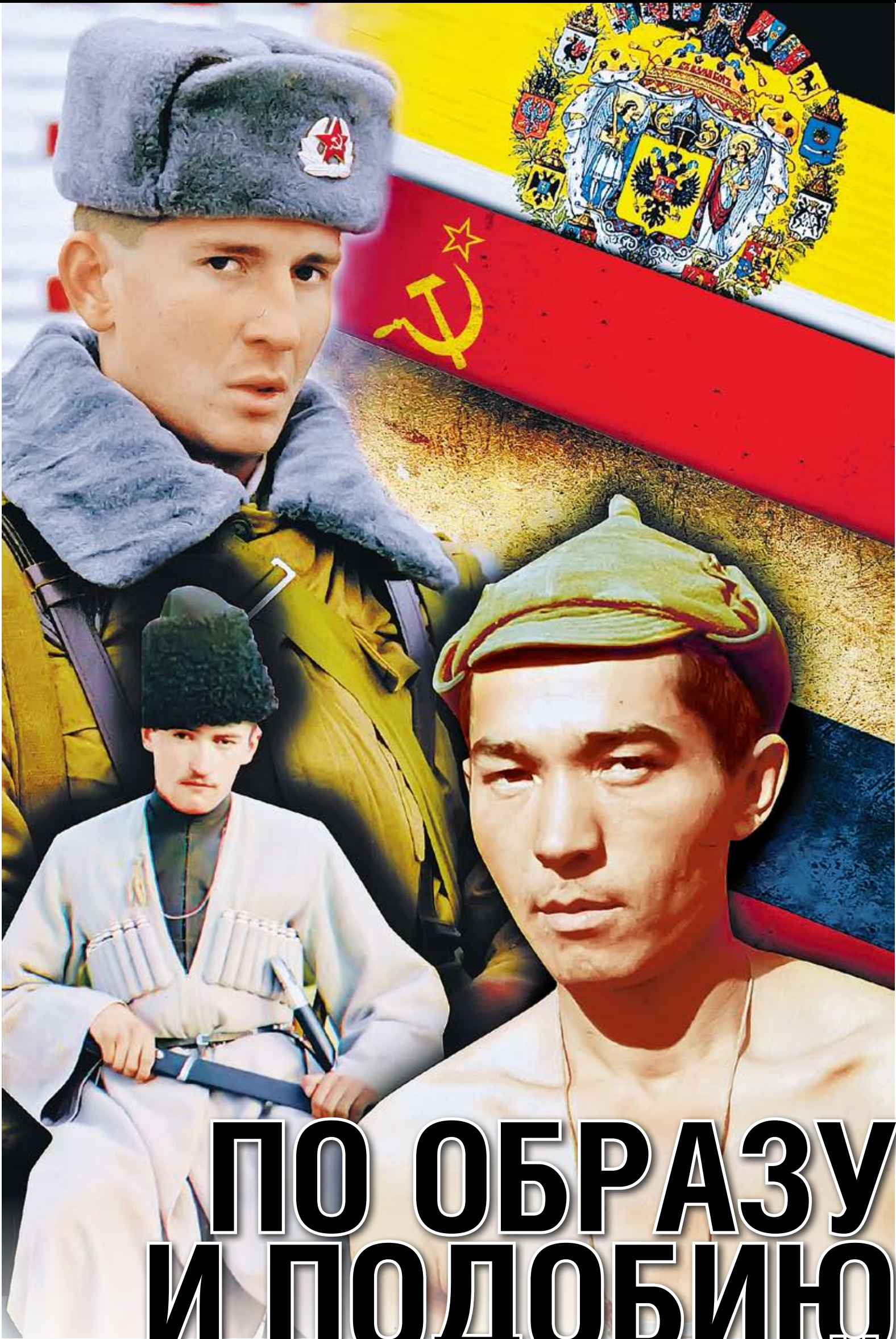
Коллаж: Аппер СЕИХ

Если представители всех прочих регионов РФ «косят» от армии всеми возможными способами и в нее идут в основном лишь представители социальных низов, то для кавказских юношей ратная служба продолжает считаться обязательной, важнейшим элементом мужской инициации. Поскольку рождаемость в республиках Северного Кавказа сама по себе гораздо выше, чем в остальной стране, эти два фактора обеспечивают очень быстрый рост доли кавказцев в рядах Вооруженных Сил. Дагестан и здесь идет в авангарде. И по численности населения, и по рождаемости он опережает