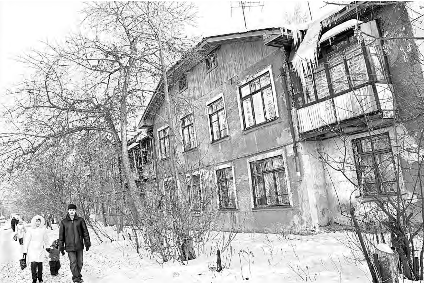
Наталья Швабауэр, УрФО