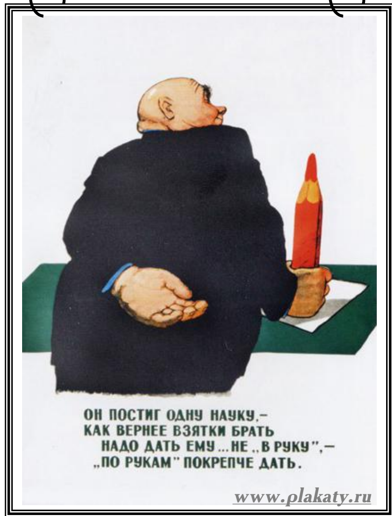
«Он постиг одну науку, — как вернее взятки брать...» Резанов Б. Г., 1956