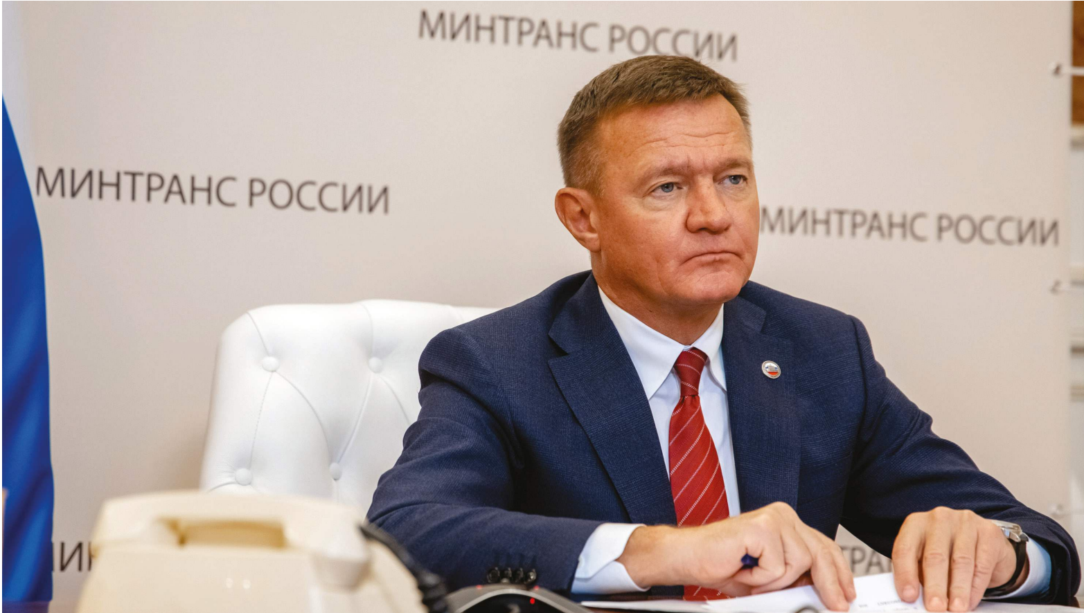
Эффективная транспортная система нового качества, которая удовлетворяет спрос как населения, так и экономики, – это цель, которая стоит перед нами в новой шестилетке

Приступая к реализации нацпроекта «Транспорт» не сомневаемся, что все задачи будут достигнуты