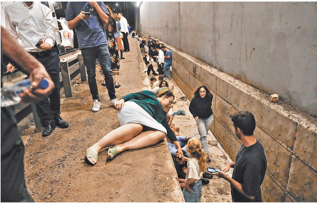
После того как в израильских городах прозвучали сирены ракетной угрозы, местные жители поспешили в укрытия.

жены места сосредоточения тяжелой военной техники и даже штаб-квартира разведки «Моссад». Впрочем, данных, подтверждающих или опровергающих эти заявления, мы не найдем: военная цензура Израиля работает эффективно. Ни фотографий горящих на летных полосах самолетов, ни видео взорванных танков никто не видел. До конца неясным остается даже тип ракет, которые применил Тегеран.