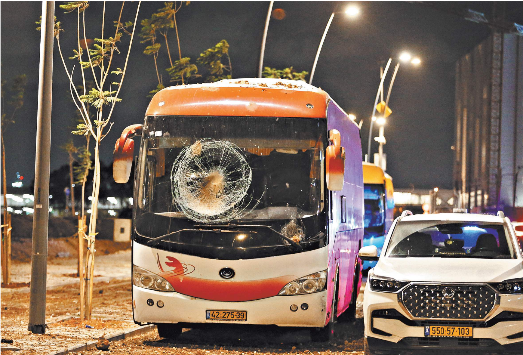
Место падения обломков иранской ракеты к северу от Тель-Авива. Иран утверждает, что почти все ракеты достигли целей. Израиль говорит об отражении атаки.

Оценивая иранскую ракетную атаку, которая получила название «Правдивое обещание-2», эксперты сталкиваются с огромным количеством противоречий. По заявлениям Израиля и США, ракет было около 180, причем они якобы не нанесли серьезного ущерба. В Вашингтоне назвали иранскую операцию «неэффективной». По официальным заявлениям Тель-Авива, в результате ударов погиб один человек, трое получили ранения. Американские военные, кстати, принимали активное участие в отражении удара. В Белом доме заранее отдали приказ об усилении боеготовности своих войск в регионе, а непосредственно ракеты сбивали два эсминца ВМС США — «Балкелли» и «Коул». Причем в Пентагоне заявили, что у американцев есть «еще много других возможностей в регионе, чтобы быть готовыми к широкому спектру угроз». Помимо