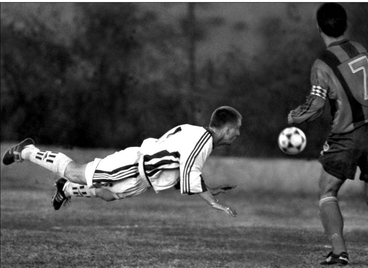
Суббота. Белек. «Зенит» - ЦСКА - 4:2. 85-я минута.

В пятый раз за эту зиму на полях Европы сошлись два клуба из высшего дивизиона России. В субботу в турецком Белеке состоялся самый интригующий пока матч межсезонья.