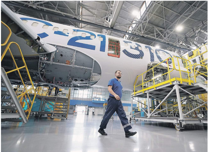
Павел Волков / «Известия»