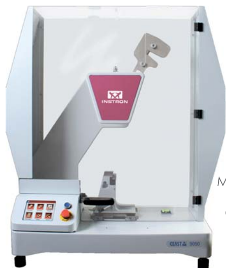
Маятниковые копры Ceast 9050