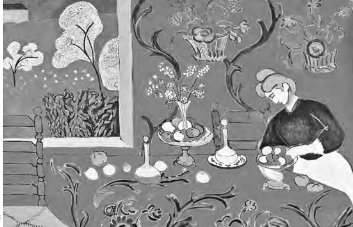
Работу Анри Матисса «Красная комната» можно будет увидеть на выставке в Париже.

Национализированная после Октябрьской революции 1917 года, коллекция Сергея Щукина в 1920-х была объединена с коллекцией Ивана Морозова в Музей нового западного искусства, а в 1948-м после закрытия музея поделена между Эрмитажем и ГМИИ им. А.С. Пушкина. В Париже коллекция Сергея