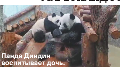
Панда Диндин воспитывает дочь.

Все больше строгих воспитательных мер предпринимает панда Диндин по отношению к своей