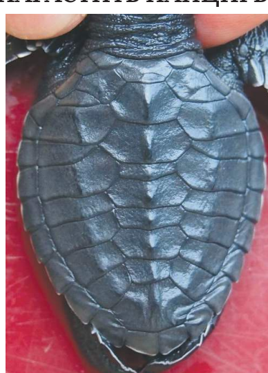
Новорожденная черепаха с увеличенным количеством щитков на панцире.

температурные воздействия в критические периоды развития черепаха. И если раньше считалось, что в естественных природных популяциях процент аномальных особей бывает невелик, оливковые черепахи (Lepidochelys olivacea) с южного побережья Шри-Ланки разрушили данный постулат. Именно их изучали зоологи СПбГУ вдоль многокилометровой береговой линии, причем исследование проводилось без изъятия животных из природной среды. Ученые фотографировали новорожденных черепах с спинной и брюшной сторон, а затем составляли подробное описание панциря и особенностей расположения роговых щитков. Зоологи изучили 655 экземпляров черепах из двести кладок и выявили 120 вариантов щиткования панциря, различающихся по числу составляющих его роговых элементов. Притом что