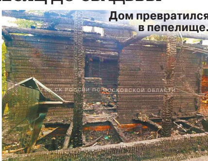
Дом превратился в пепелище.

В 4 часа ночи соседи увидели дым из трубы и вызвали экстренные службы. По словам очевидцев, в этот момент здание, построенное из бруса, уже было практически полностью охвачено огнем. После тушения пожара внутри были обнаружены тела