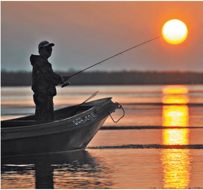
Некоторые россияне считают, что лучший отдых — это рыбалка.