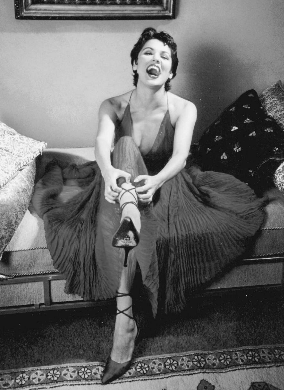
Оперная дива АННА НЕТРЕБКО — главная звезда только что открывшегося Зальцбургского фестиваля

Марию Шарапову задержали в лондонском аэропорту — за попытку нелегального провоза оружия. В багаже теннисистки нашли нунчаки, с помощью которых она разминает травмированное плечо. А знаменитый баритон Дмитрий Хворостовский выступает сегодня на кемеровском стадионе «Химик» перед шахтерами Кузбасса — на концерт он прибыл из Британии. Эти и другие известные россияне последнее время нечасто навещают на родину, предпочитая жить на своих заморских виллах. Но все равно они — наши, с российскими паспортами. В консульской службе МИД не смогли сказать, сколько наших сограждан живут на два дома — в отечестве и в зарубежье. Когда дела у них идут хорошо, на учет в консульствах они не становятся. Зато бегут, когда приходит беда. В посольстве России в Лондоне есть данные всего на четыре тысячи человек — а обитают в Британии до полумиллиона наших соотечественников. Кто «за бутром» самый-самый россиянин — со знаком «плюс» и со знаком «минус»? → стр. 8