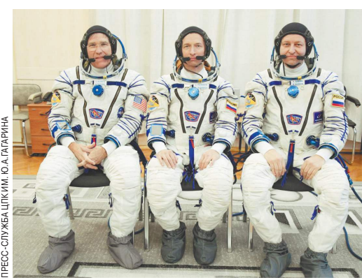
ПРЕСС-СЛУЖБА ЦПКИ Ю.А.ЛАРИНА