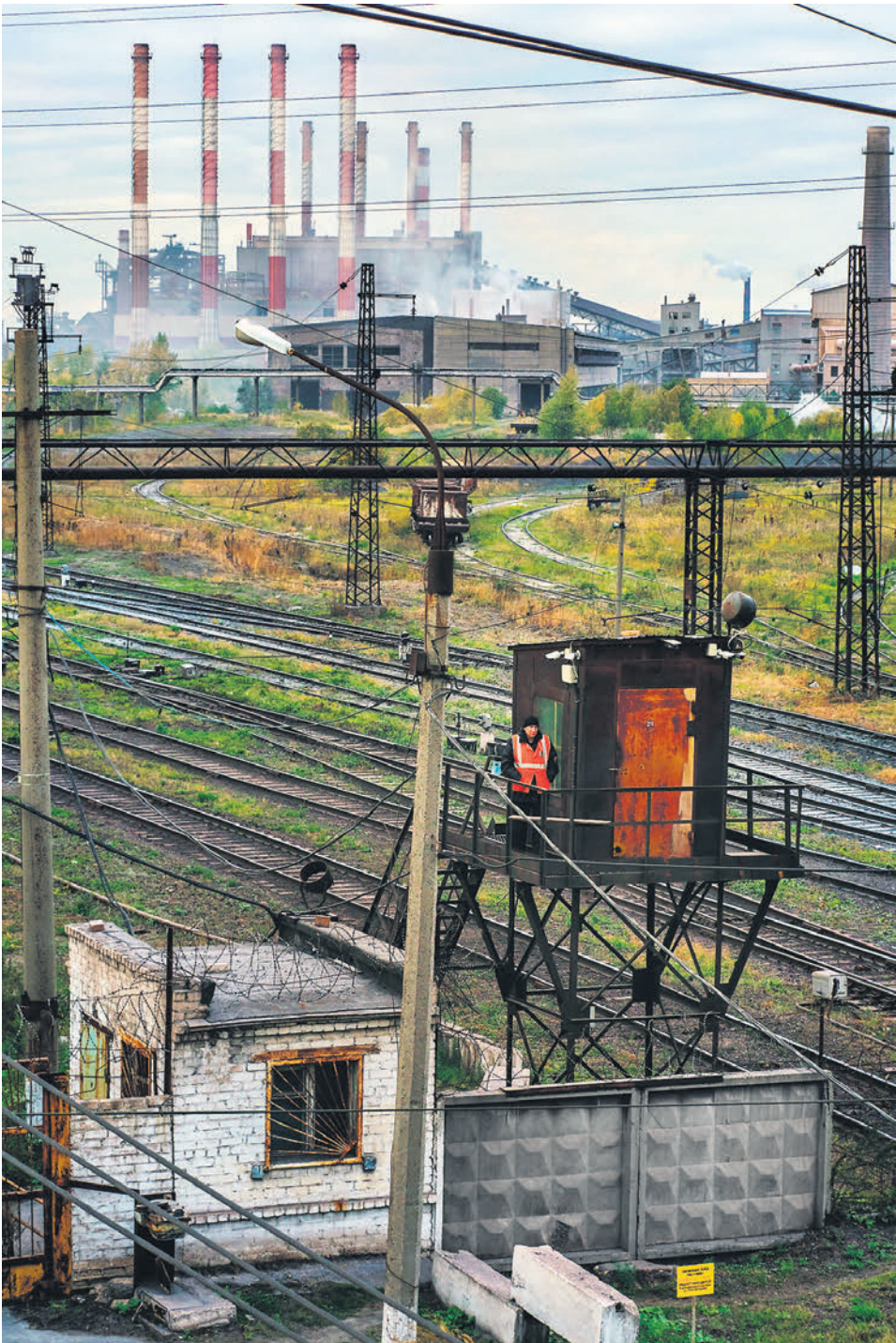
На фоне роста террористической угрозы железные дороги хотят собирать с клиентов еще процент на безопасность

Однако источник, знакомый с позицией ОАО РЖД, утверждает, что затраты на транспортную безопасность в 2022 году превы-