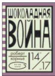
Кормье Р. Шоколадная война / Пер. с англ. В.Бабкова. М.: Розовый жираф, 2012. — 248 с. — (Вот это книга!).

5 «Его убили», — вот первая фраза, с которой начинается роман американского писателя Роберта Кормье (1925–2000). Преувеличение? Да нет, ведь речь действительно о войне, пускай и шоколадной, детской, школьной, разва-завшейся, в сущности, из-за пустяка. Как и в «Повелителе мух».