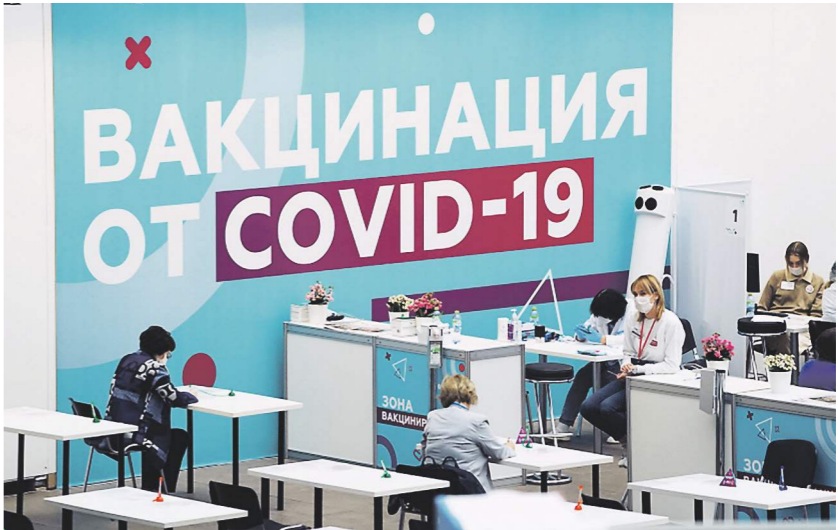
Павел Волков / Ифотосток