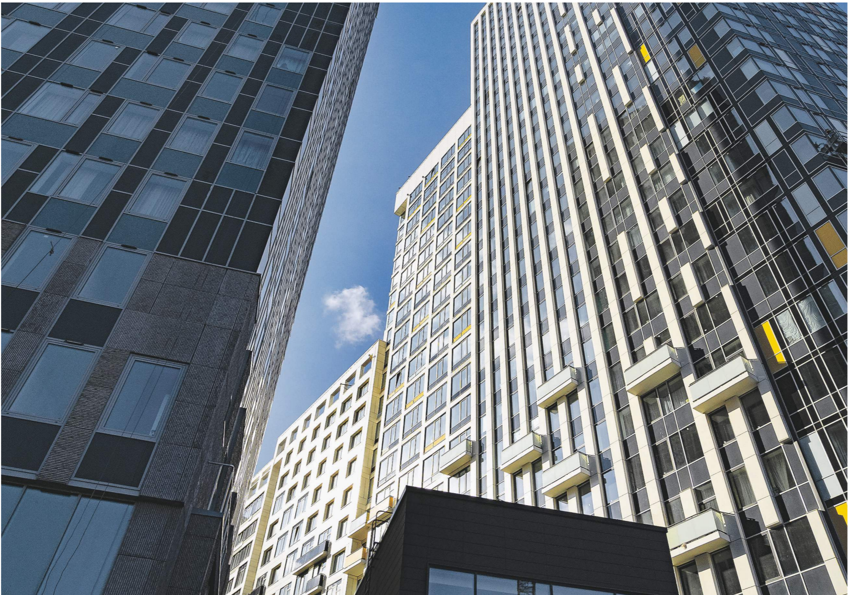
Константин Кошкин / Ифотосток