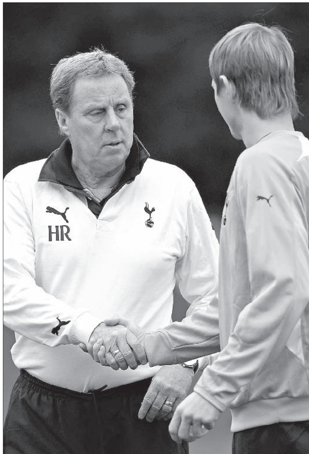
Сентябрь 2010 года. Лондон. Главный тренер «Тоттенхэма» Харри РЕДНАПП с российским легионером Романом ПАВЛЮЧЕНКО.

Знаменитый английский тренер, известный по работе в «Вест Хэме» и «Тоттенхэме», в интервью «СЭ» поделился мнением о грядущем чемпионате Европы и о судьбах сборных Англии и России