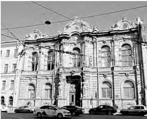
Еще недавно здание занимало общество «Знание».

Государственный музей-памятник «Исаакиевский собор» полностью отреставрирует дворец Зинаиды Юсуповой в центре Петербурга. Работы запланированы ориентировочно на 2023–2024 годы. Здесь будет культурно-музейное пространство.