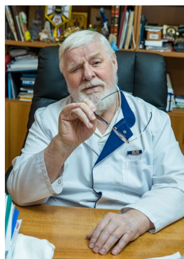
Валентин Дикуль. Простой останкинский святой