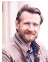
Александр Скворцов – фотокорреспондент