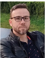
Денис Грачев – дизайнер, который сверстал этот номер