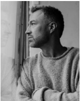
Александр Яковлев – один из ведущих балетных фотографов России, с многотысячной армией поклонников и принтами, известными на весь мир. Автор обложки и свадебной фотоистории