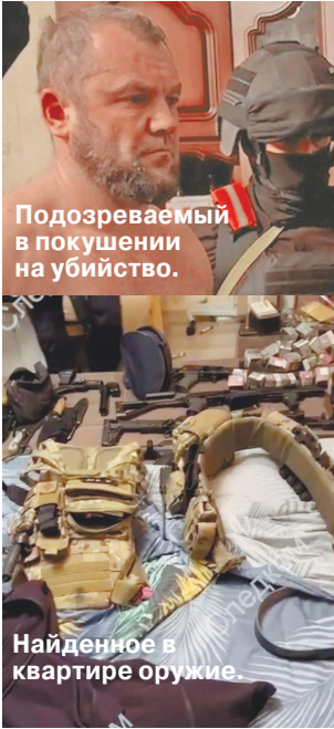
Подозреваемый в покушении на убийство.