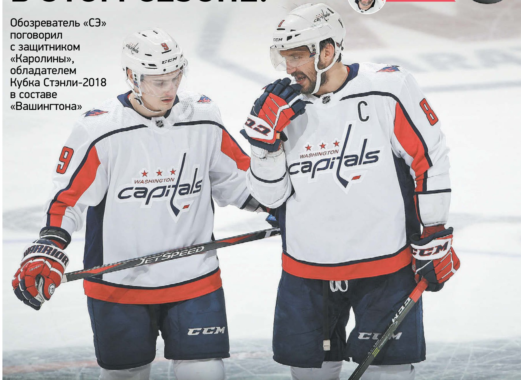
2018 год. Дмитрий Орлов и Александр Овечкин (справа) в составе «Вашингтона»

Обозреватель «СЭ» поговорил с защитником «Каролины», обладателем Кубка Стэнли-2018 в составе «Вашингтона»