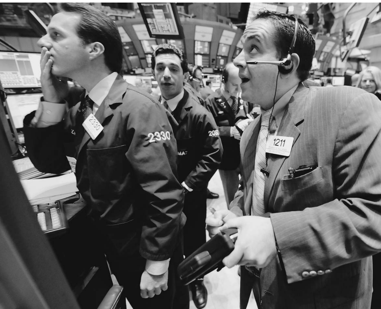
Чтобы хорошо работалось, биржевикам нужен кураж