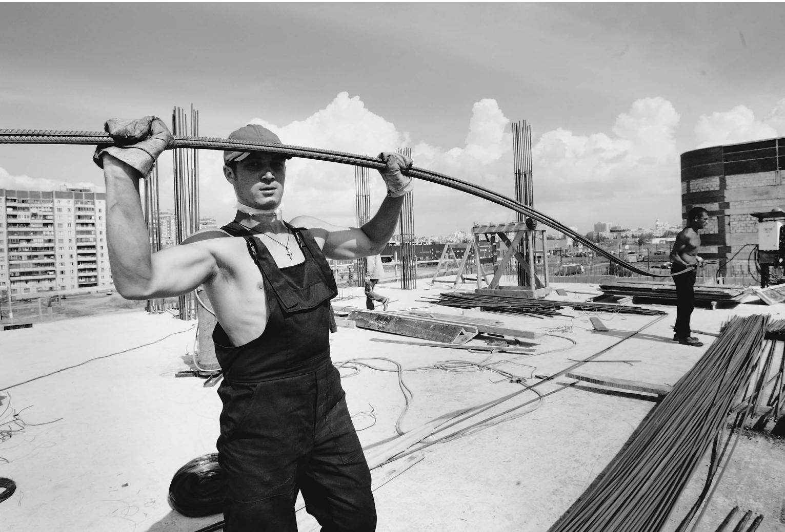
Через 20 лет более половины россиян смогут купить квартиру. Осталось только построить заветные «метры»

Правительство реформирует систему ипотечного кредитования до 2030 года