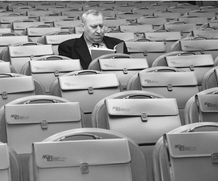
Правительство пытается сократить число чиновников, а они все размножаются