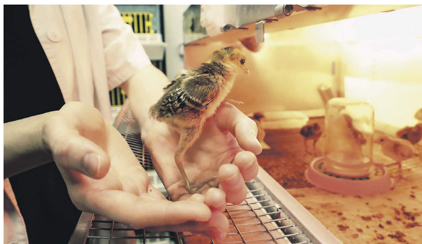
Маленькие фазанята уже подрастают в лабораторном брудере

Научные сотрудники факультета биотехнологий и рыбного хозяйства Московского государственного университета технологий и управления им. К.Г. Разумовского разрабатывают метод массового разведения фазанов. В лабораториях факультета индустриальным способом уже получили первое поколение птенцов с повышенной выживаемостью. 07 →