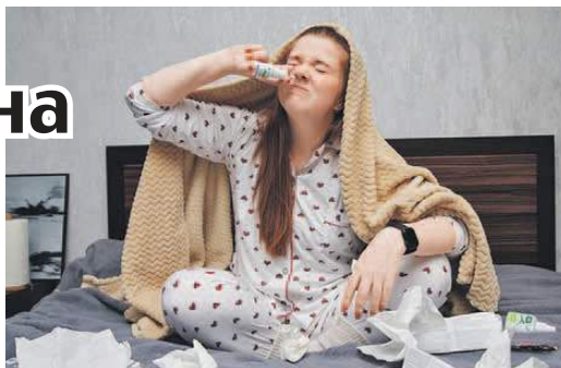
Оксана ЗУЙКО/«КП» - Москва