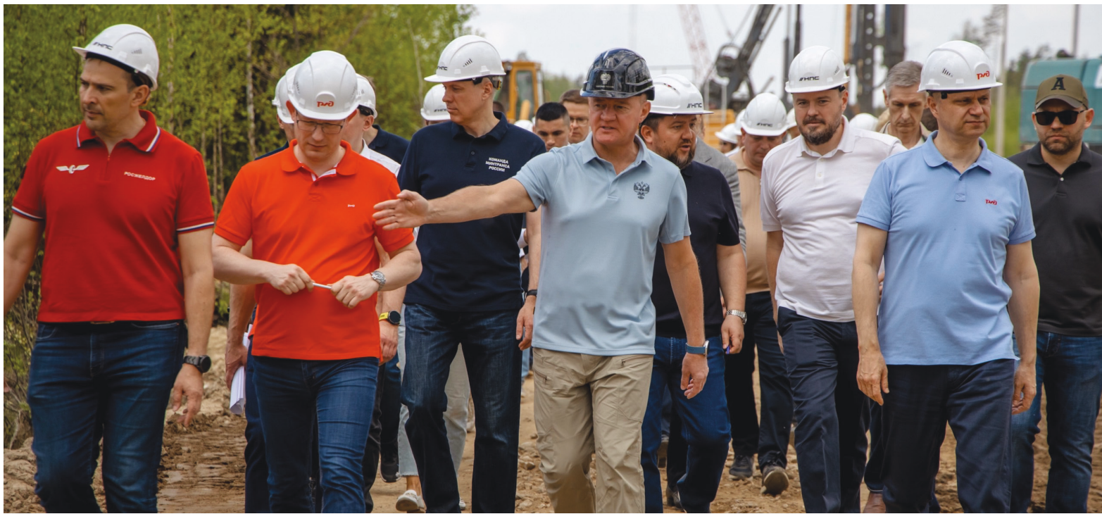
Через три года здесь поедут высокоскоростные поезда.

В Подмоскovie начата подготовка территории под прокладку ВСМ