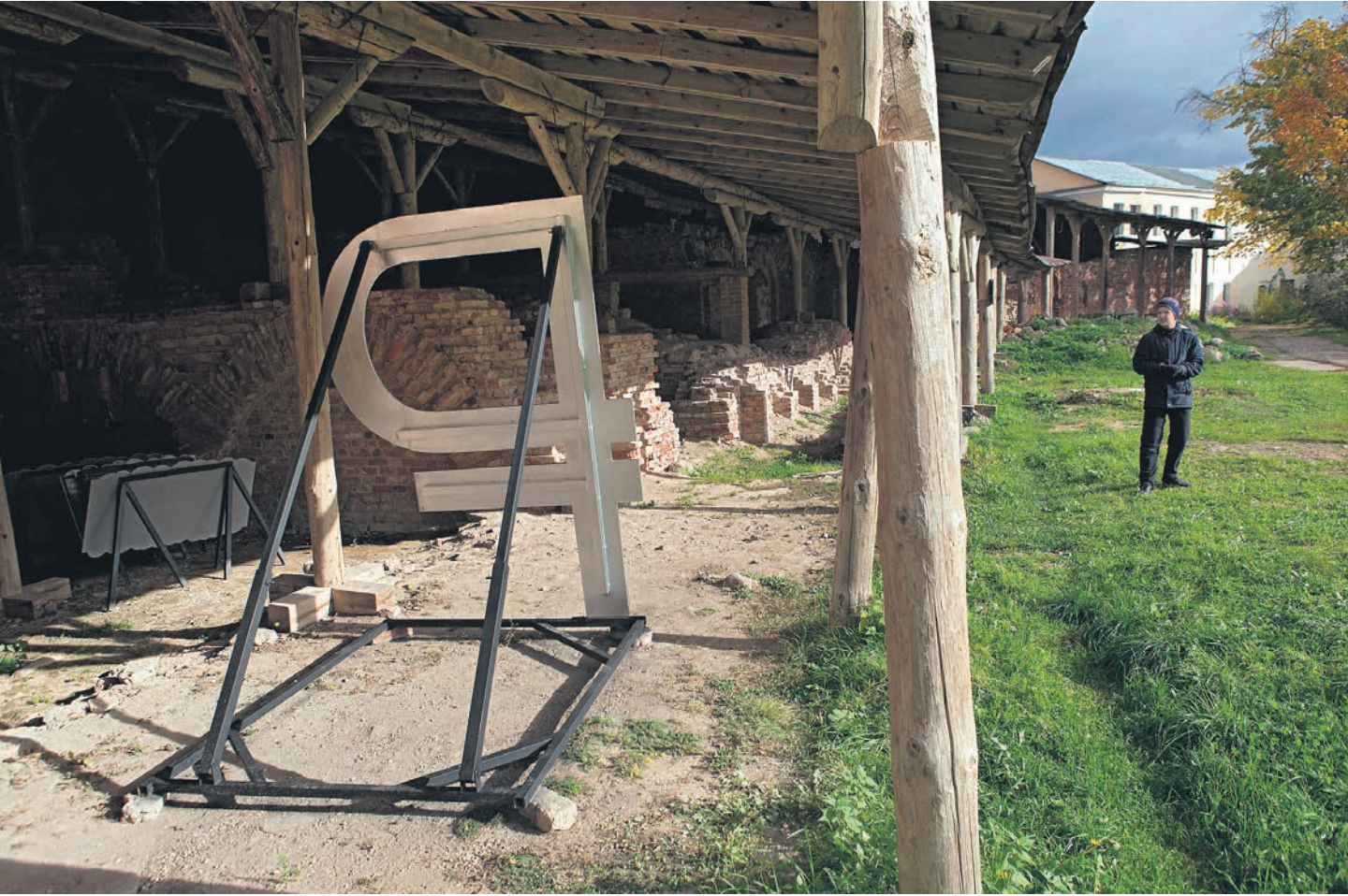
Обратной стороной тревожащего всех в августе ослабления национальной валюты эксперты видят больший рост ВВП и зарплат

Предполагается о том, что слабость рубля вызвана будущими скрытыми проблемами федерального бюджета, аналитиками не разделяется: за два месяца они понизили ожидания его дефицита и на 2023-й, и на 2024 год. Оценки динамики импорта и экспорта остались, по сути, неизменными, тогда как прогнозы фактических цен на экспортную нефть РФ выросли. Эксперты также верят в более высокую динамику ВВП РФ 2023 года — 2,2% против предыдущих прогнозов