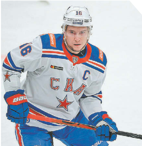
Федор Успенский «СЭ» / Canon EOS-1DX Mark II