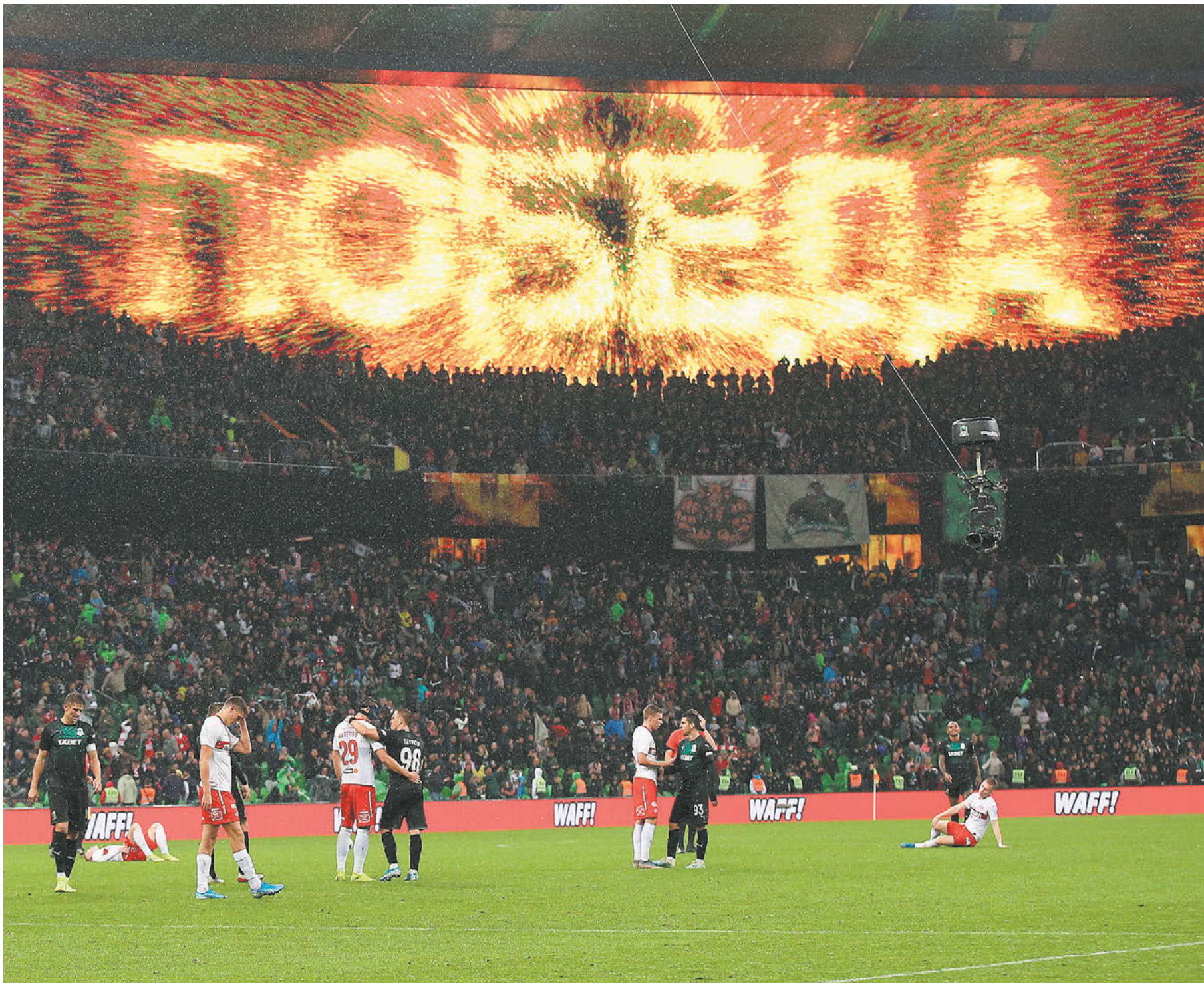
На матчах РПЛ часто бывают аншлаги. Но сейчас и 10 процентов от возможных зрителей можно смело назвать прорывом

Вчера РФС получил от Роспотребнадзора разрешение на рестарт чемпионата России 21 июня. При этом клубы получают право заполнять трибуны своих домашних стадионов на 10 процентов от общей вместимости