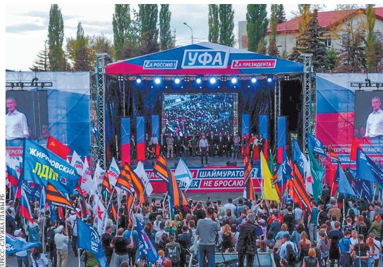
ПРЕСС-СЛУЖБА ПРАВИТЕЛЬСТВА РБ

В Уфе в поддержку референдумов о вхождении в состав России Донбасса, Запорожия и Херсонщины прошел митинг-концерт «Потомки Шаймуратова своих не бросают!» По данным пресс-службы правительства РБ, на площади перед конгресс-холлом «Торатау» собрались более 20 тысяч человек. Программа началась с совместного исполнения гимна России Государственной академической хоровой капеллой и многочисленных зрителей. На сцене выступали звезды башкирской эстрады, а также общественные и политические деятели, которые говорили об исторической важности референдумов.