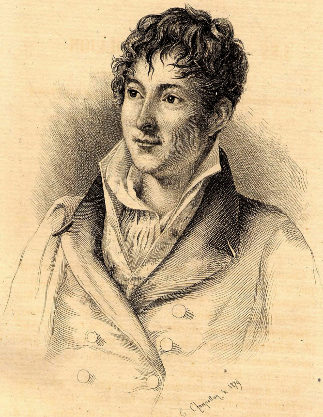
CHAMPOLLION-FIGEAC (JACQUES-JOSEPH) Né le 5 Octobre 1778 — + 6 Mai 1867.