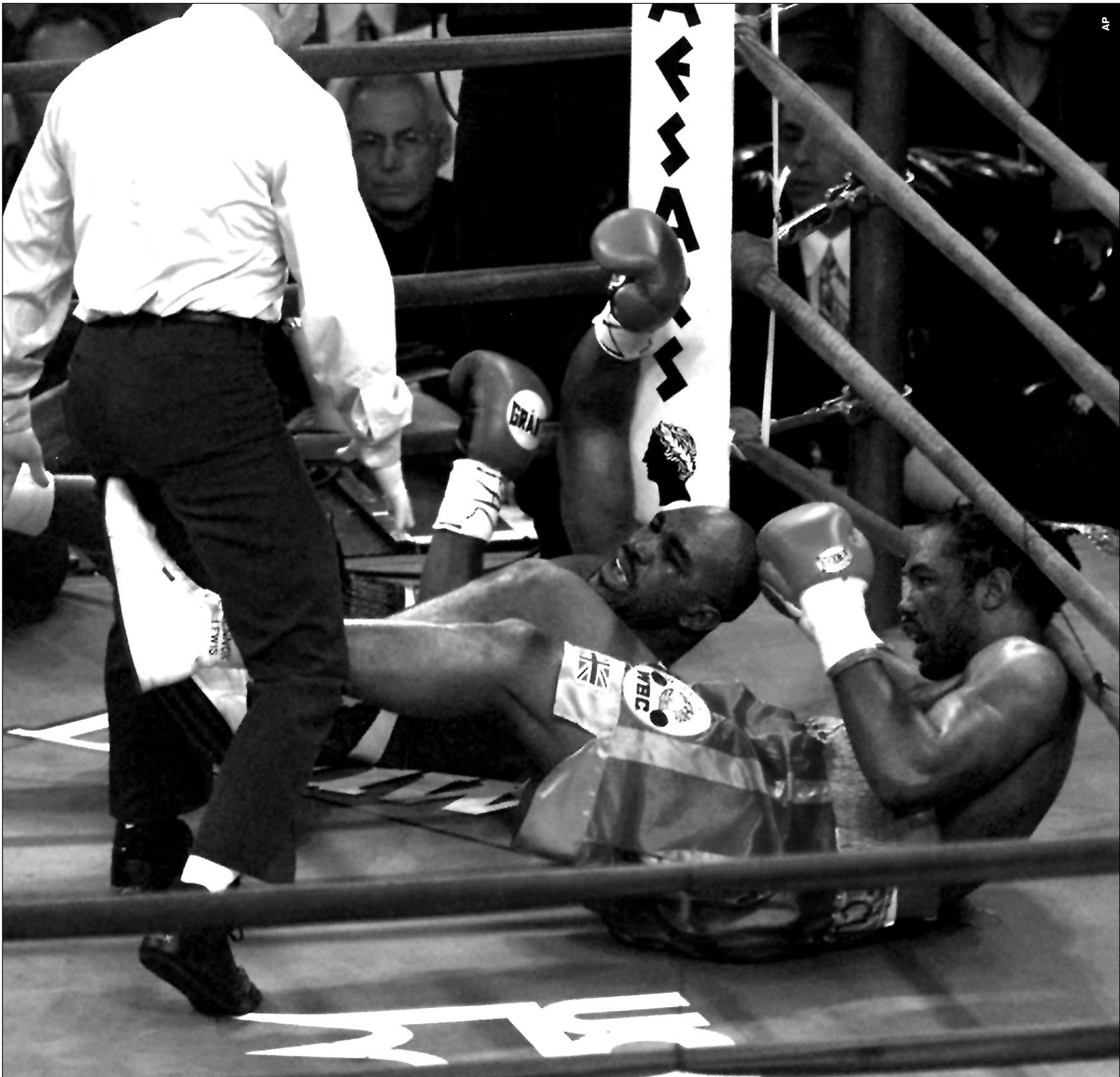
Суббота. Нью-Йорк. Madison Square Garden. Эвандер ХОЛИФИЛД - Леннокс ЛЬЮИС (справа): «ничейная» ситуация в седьмом раунде вовсе не говорила о равенстве сил.

Супербой за звание абсолютного чемпиона в тяжелом весе между американцем Эвандером Холифилдом и англичанином Ленноксом Льюисом, который состоялся в субботу в Нью-Йорке, завершился конфузом! Несмотря на полное, по мнению большинства специалистов, преимущество Льюиса, в поединке была зафиксирована ничья - возможно, самая скандальная в нынешнем столетии.