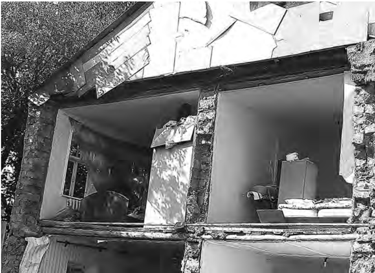
17 октября удом на улице Ермошкина обвалилась стена.