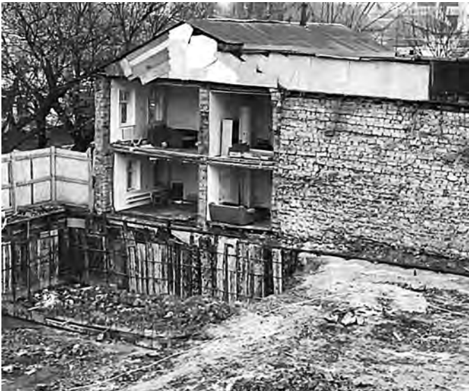
Тот же дом 7 декабря.