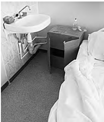
Фото картонных тумбочек появились в соцсетях.

—В отделе гнойной хирургии осенью был ремонт и провели закупку новой мебели: 30 кроватей и 30 тумбочек. По вине грузоперевозчика во время доставки новых тумб восемь штук были повреждены и возвращены поставщику для замены. В отделении временно установлены тумбочки учреждения,