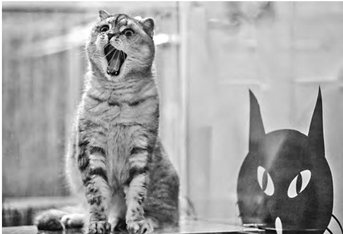
Даже ласковые кошки в последнее время вынуждены показывать зубы в общении с человеком, чтобы защититься от живодеров.

С подобной инициативой выступили трое депутатов Госдумы. Они предлагают внести жесткие правки в статью 245 Уголовного кодекса «Жестокое обращение с животными». Сегодня по ней предусмотрены достаточно мягкие санкции.