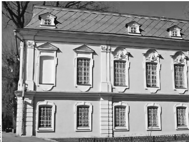
Палаты Долгоруковых неоднократно меняли хозяев