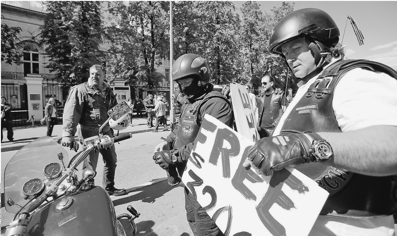
Московские мотоциклисты собрались на акцию перед посольством Ирака, чтобы поддержать своих товарищей