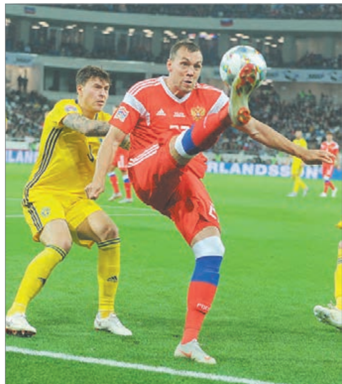
Вчера. Калининград. Россия - Швеция - 0:0. С мячом - форвард нашей сборной Артем ДЗЮБА.

Вчера на фоне скандала вокруг Кокорина и Мамаева сборная России провела матч Лиги наций со Швецией. Итог - нулевая ничья в Калининграде.