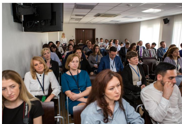
Президиум и участники VII Всероссийской научно-практической конференции «Лечебная физическая культура и спортивная медицина: достижения и перспективы развития», 31.05.2018 г.

В Институте физической культуры еще с 1920-х годов начинают читаться следующие учебные дисциплины: врачебная гимнастика, массаж, патология общая и частная, физиотерапия, механотерапия и др.