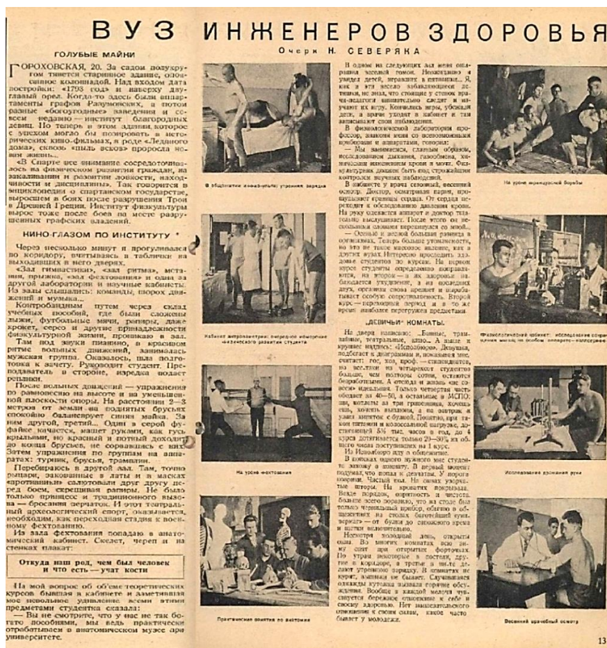
Очерк Н. Северяка «Вуз инженеров здоровья» (журнал «Смена», №102, май 1928 г.)

Когда-то в далеком 1928 году в год празднования 10-летия Института физкультуры на страницах журнала «Смена» Н. Северяк назвал наш институт «ВУЗ инженеров здоровья». «ВУЗ инженеров здоровья» - так назвал наш институт Н. Северяк на страницах журнала «Смена» в год празднования 10-летия Института физкультуры в далеком 1928 году. Молодой институт готовил специалистов, в руках которых была уникальная возможность - укрепить здоровье миллионов советских граждан.