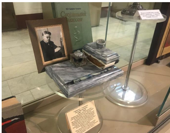
Личные вещи и научные труды профессора И.М. Саркизова-Серазини из коллекции Историко-спортивного музея РГУФКСМиТ

В монографии использованы архивные материалы (фотографии, документы и пр.), хранящиеся в Историко-спортивном музее РГУФКСМиТ.