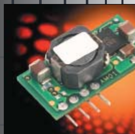
Выбор модуля питания для вашего приложения