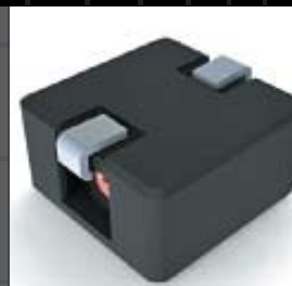
Индуктивные компоненты компании Premo