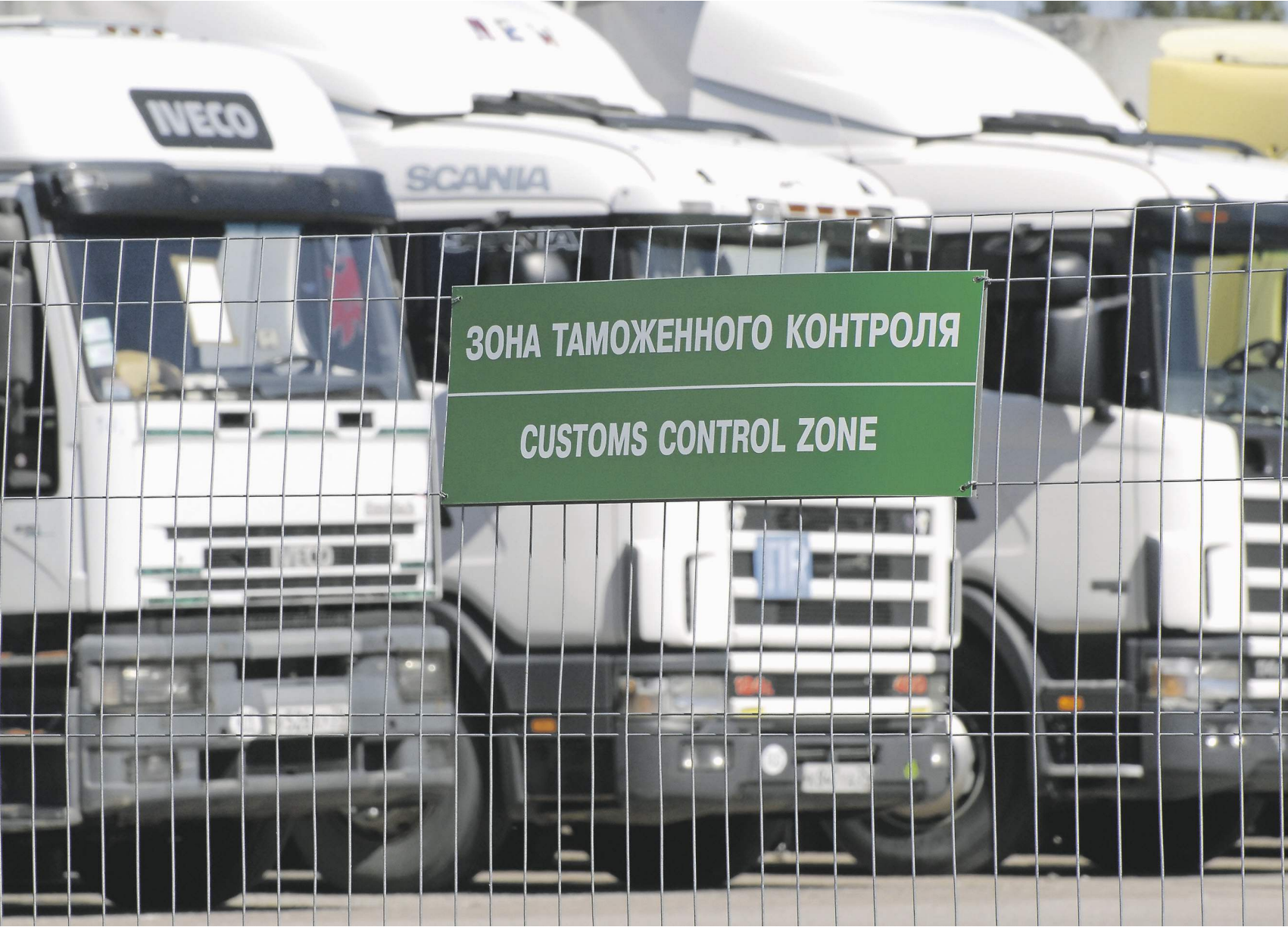
Курей Еленовский / ТАСС

По словам последнего, документ ещё обсуждают в профильных ведомствах, и решения по его принятию нет.