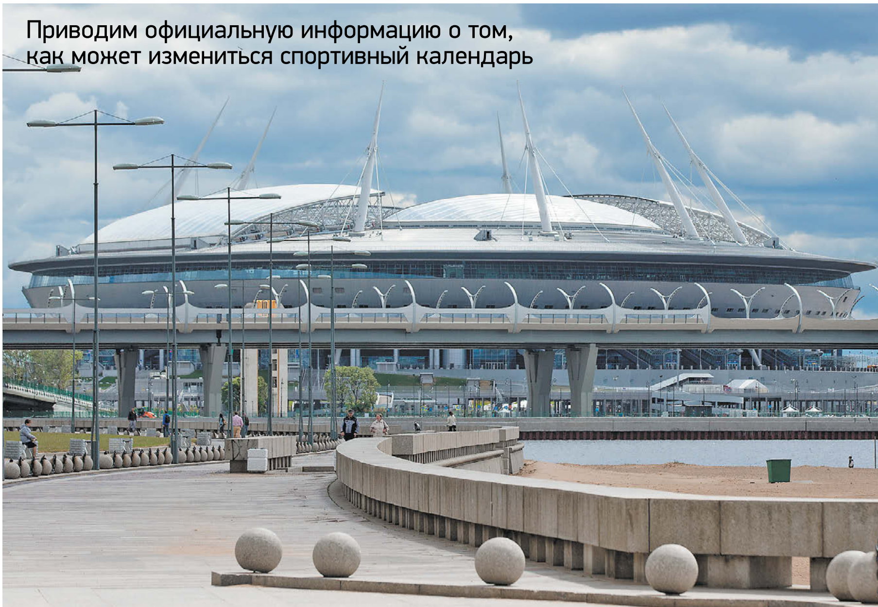
Санкт-Петербург. «Газпром Арена»

Приводим официальную информацию о том, как может измениться спортивный календарь