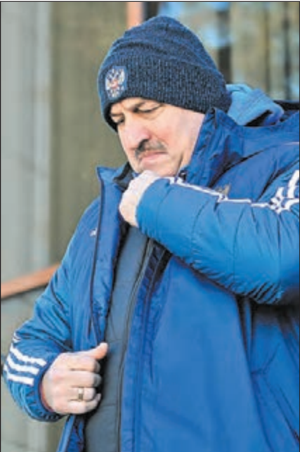
Главный тренер сборной России Станислав ЧЕРЧЕСОВ.