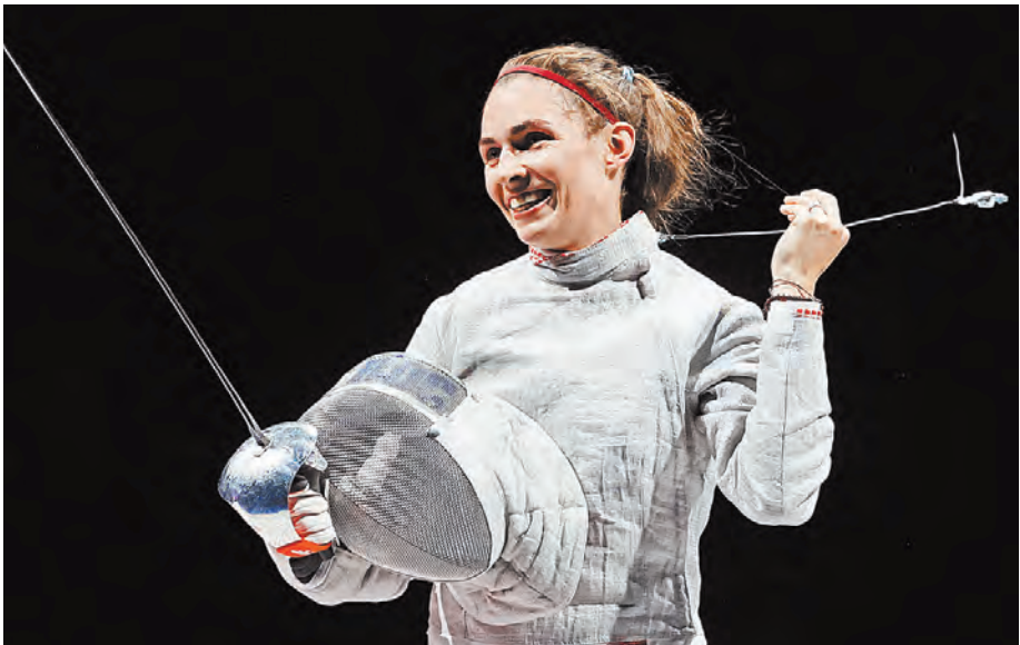
Для 24-летней Поздняковой эти Игры стали первыми в карьере. И сразу оглушительный успех!

ТРАНСПОРТ Продажи льготных авиабилетов для семей стартуют к середине августа