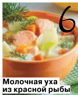
Молочная уха из красной рыбы