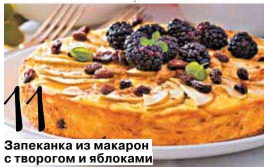
Запеканка из макарон с творогом и яблоками