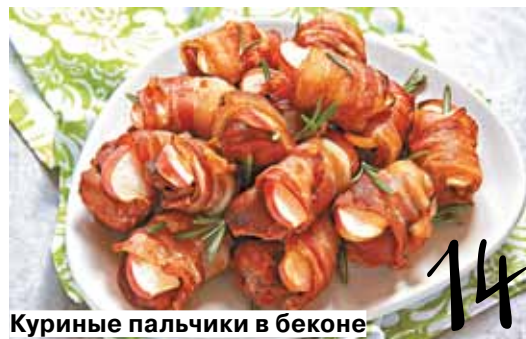
Куриные пальчики в беконе

нового сока, жарить рыбу правильно, приготовить сочную и нежную печень и т.п.