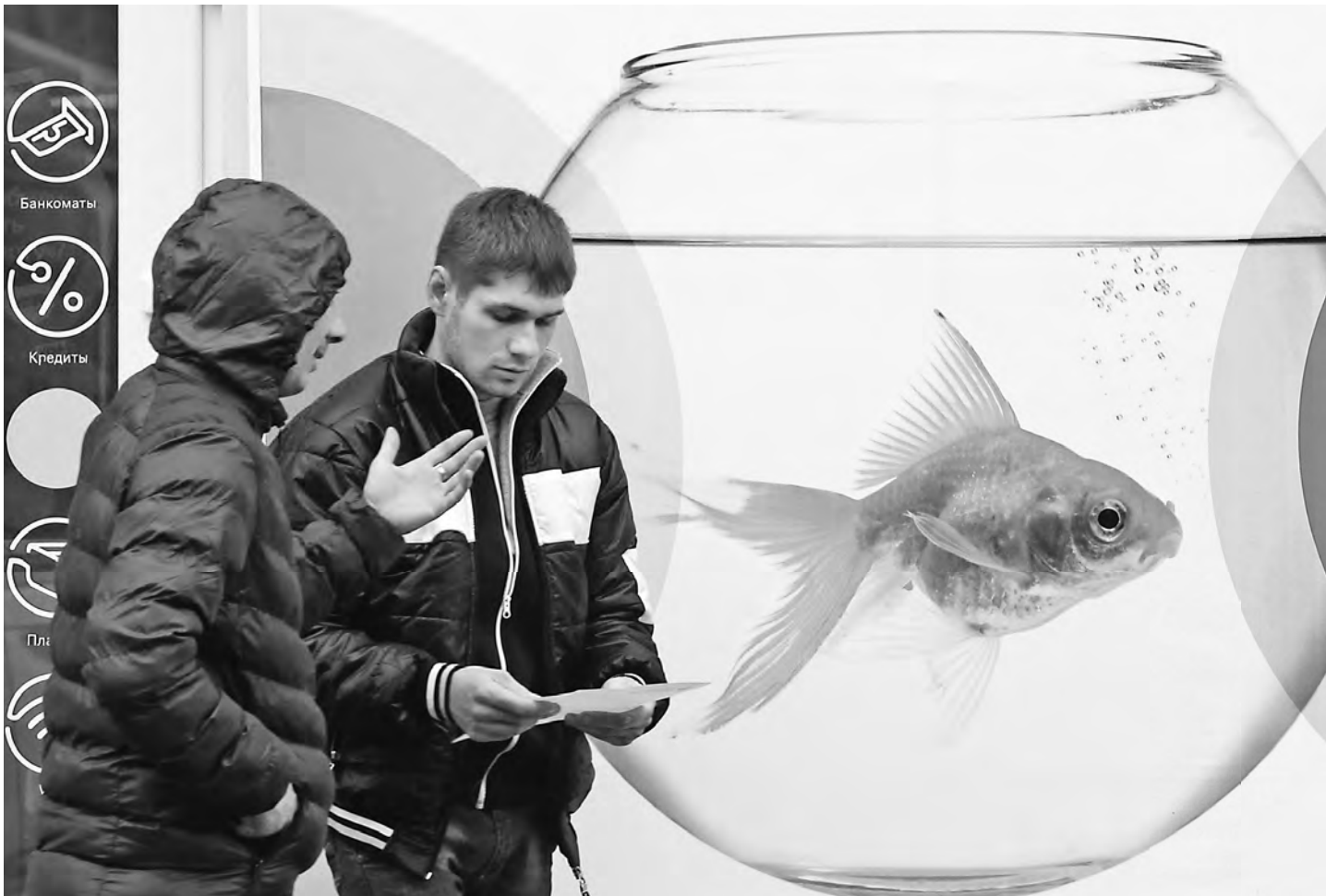
У золотой рыбки россияне просят не только богатства, но и уверенности в будущем.