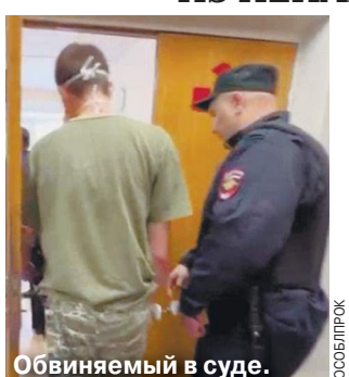
Обвиняемый в суде.

16-летний подросток, нававший на двух девочек в дачном поселке в Домодедовском районе Московской области, после совершения преступления пытался покончить с собой. Однако ему помешали родители.