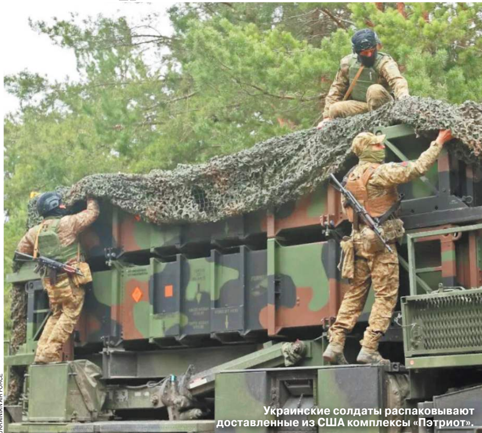
Украинские солдаты распаковывают доставленные из США комплексы «Пэтриот».